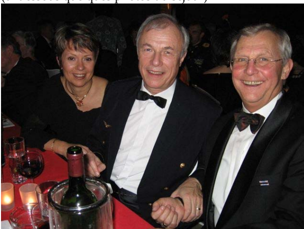
Secrétaire, président et Bürgervorsteher