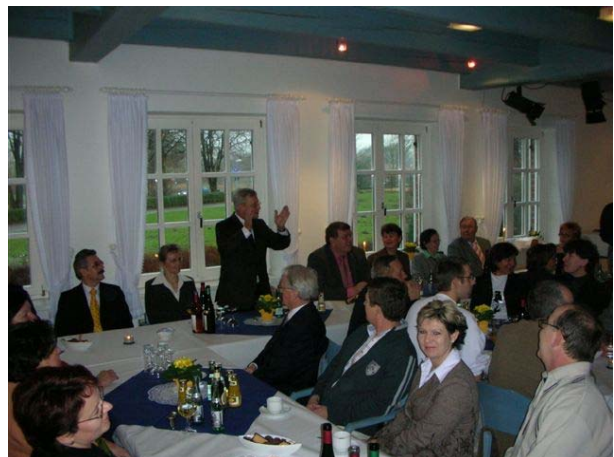
Le traditionnel repas de toutes les délégations