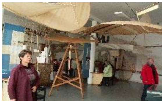
Visite du musée de l'aéronautique (Otto Lilienthal) à Anklam