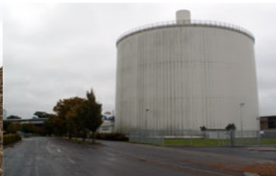
L'usine de bio-éthanol Danisco à Anklam