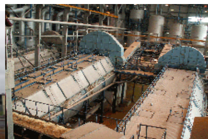
Intérieur de l'usine Danisco